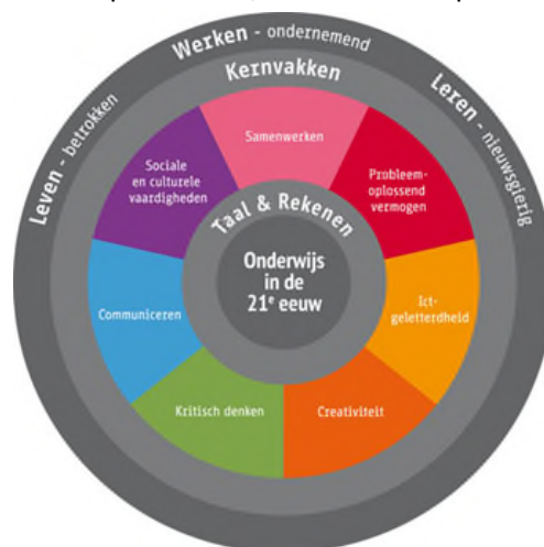
Afbeelding 3: het onderwijs in de 21 ste eeuw

Floreren, dat is de basis. Tot volle ontplooiing komen. Op onze school geloven we dat ieder kind uniek is en zichzelf kan ontwikkelen vanuit de natuurlijke basisbehoefte relatie, competentie en autonomie. Het onderwijs op De Piramide sluit zo dicht mogelijk aan bij de ontwikkelbehoeften van elk kind. Het onderwijs is passend en positief en het geeft ruimte voor persoonsontwikkeling. Vanuit de veiligheid van een vaste jaargroep werkt elk kind aan zijn ontwikkeling. Elk leerjaar kent basisstof voor de kernvakken. We werken met leerlijnen en stellen vast wat het kind nodig heeft. Een basisaanpak, een intensieve aanpak of een uitdagende aanpak. Het onderwijs is afwisselend en uitdagend. De Piramide biedt de kinderen een veelheid aan werkvormen en lesmaterialen, waarbij ook de 21 e eeuwse vaardigheden aan bod komen. In de ochtend staan veelal de kernvakken centraal, in de middag is er ruimte voor onderzoekend en ontwerpnd leren, creativiteit en persoonsvorming.