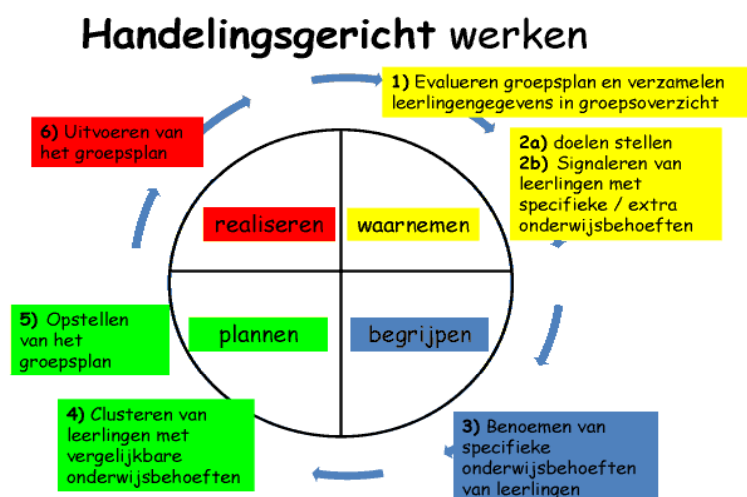
Afbeelding 6: handelingsgericht werke

Wij werken in het plannen van het aanbod en volgen van de ontwikkeling van onze leerlingen, volgens de cyclus van handelingsgericht werken: waarnemen, begrijpen, plannen en realiseren.