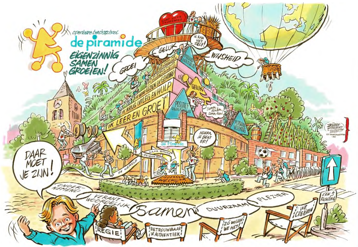
Afbeelding 2: schoolplaat