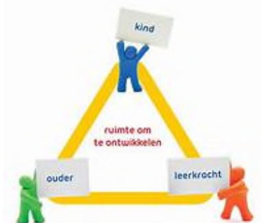
Afbeelding 5: driehoeksgesprek

Bij de start van het schooljaar vinden er startgesprekken plaats. Voor de groepen 1-2-3 vinden de startgesprekken plaats tussen leerkracht(en) en ouder(s) en voor de groepen 4 t/m 8 met leerkracht(en), ouder(s) en kind. Het doel van deze gesprekken is het creëren van contact, verbondenheid en vertrouwen. Samen nadenken over wat er nodig is. Vanaf groep 4 is het kind hierbij aanwezig en wordt het gesprek ook samen gevoerd met het kind.